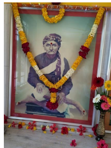
Sri Bhausaheb Maharaj