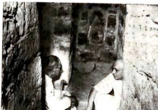
Cueva de Kadheri donde la tradición señala que se produjo la transmisión