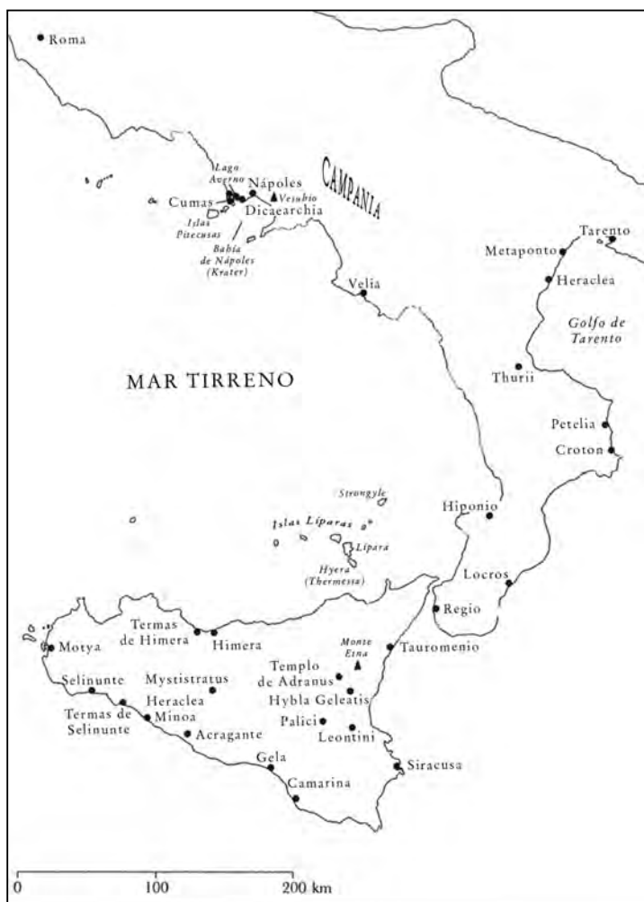
MAPA DE SICILIA Y SUR DE ITALIA